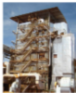
CALDEIRA 120TON x 21KGF_FIG2