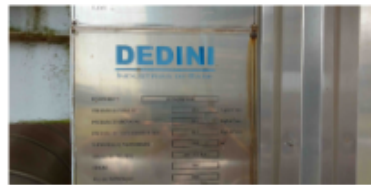
CALDEIRA 120TON x 21KGF_FIG11