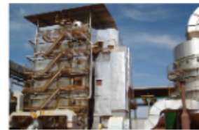
CALDEIRA 120TON x 21KGF_FIG5