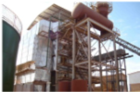
CALDEIRA 120TON x 21KGF_FIG6