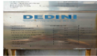
CALDEIRA 120TON x 21KGF_FIG9