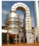
CALDEIRA 120TON x 21KGF_FIG8