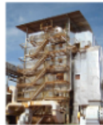
CALDEIRA 120TON x 21KGF_FIG9