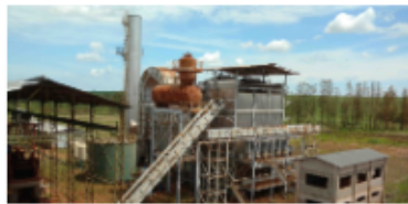
CALDEIRA 120TON x 21KGF_FIG3