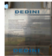
CALDEIRA 120TON x 21KGF_FIG12