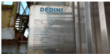
CALDEIRA 120TON x 21KGF_FIG10