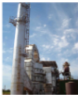
CALDEIRA 120TON x 21KGF_FIG1